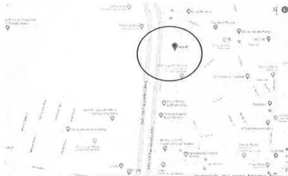
Mapa de localización