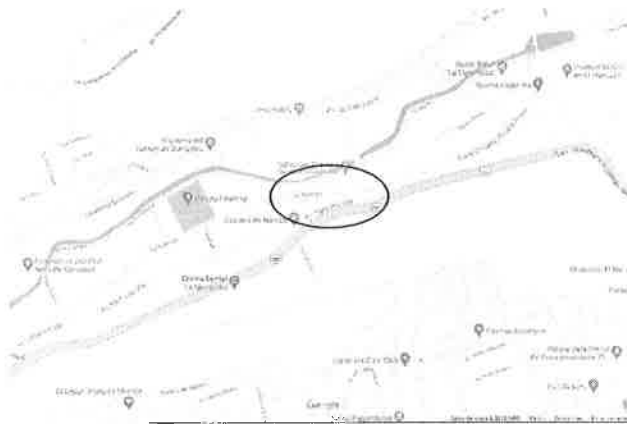
Mapa de localización